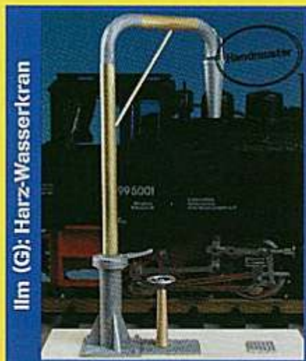
Ilm (G): Harz-Wasserkran