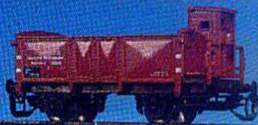
O-Wagen der DRG mit Bremserhaus (Epoche II)