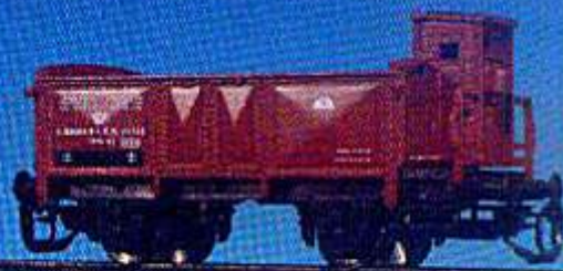
O-Wagen der k.sä.St.B. mit Bremserhaus (Epoche I)