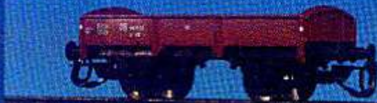
Niederbordwagen der DB (Epoche III)