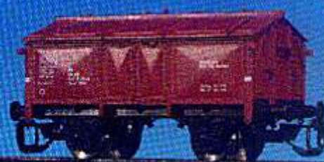
Sandwagen der DR, Typ Wuppertal, (Epoche III)