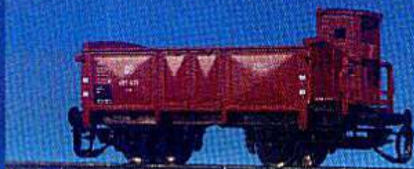
O-Wagen der DB mit Bremserhaus (Epoche III)