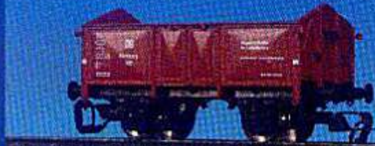
Abfallwagen-Wagen der DB (Epoche III)