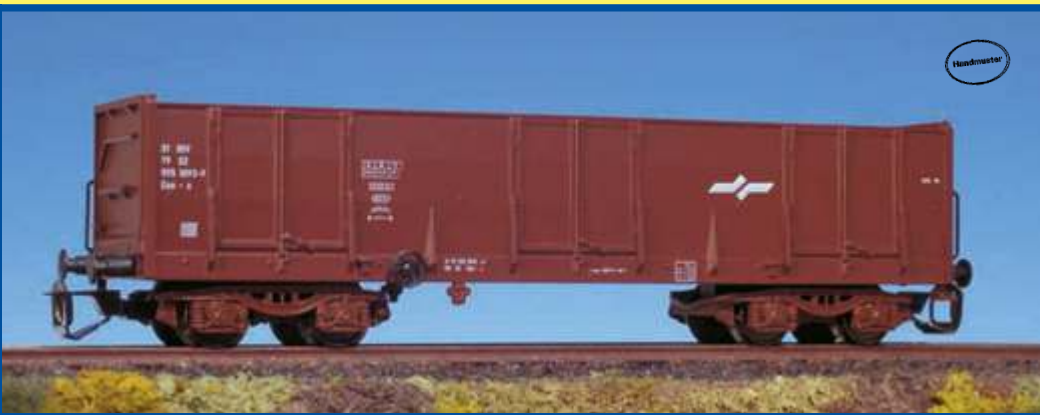
Hochbordwagen Typ LOWA der SZ (Slowenien) (Epoche V) Best.-Nr. 65372 ca. III/2006