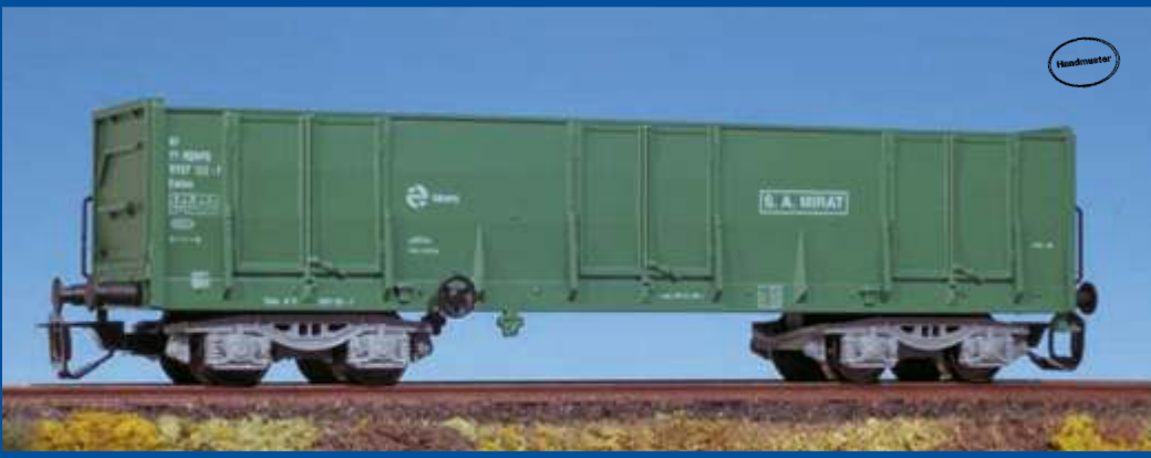
Hochbordwagen Typ LOWA der RENFE (Spanien) (Epoche V) Best.-Nr. 65370 ca. III/2006