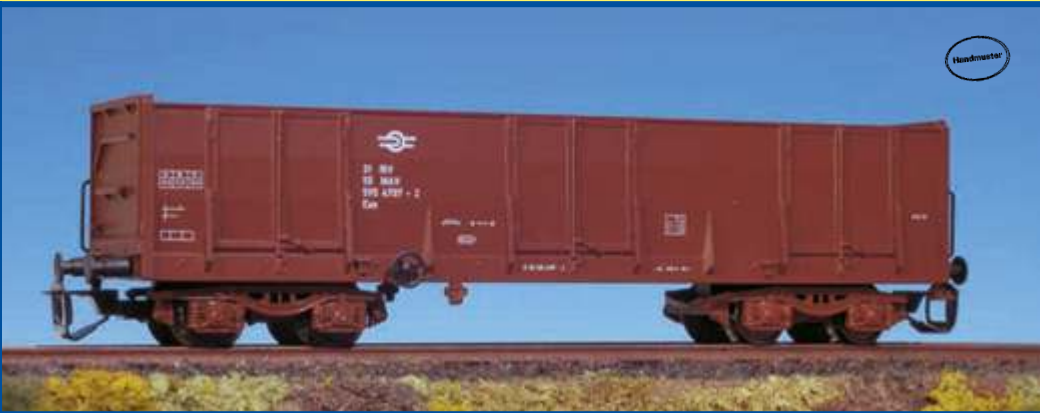
Hochbordwagen Typ LOWA der MAV (Ungarn) (Epoche IV/V) Best.-Nr. 65371 ca. III/2006