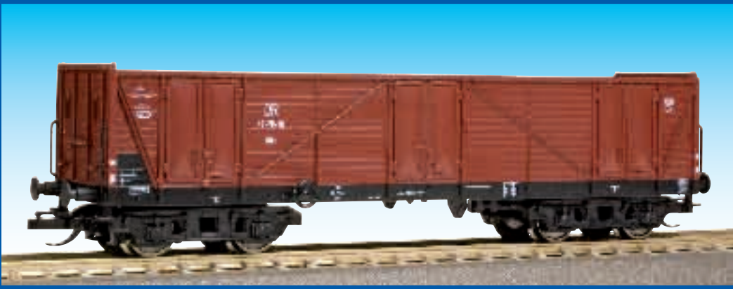
Hochbordwagen Typ LOWA der DR Epoche IV Best.-Nr. 65313 (TT) ca. II/2007