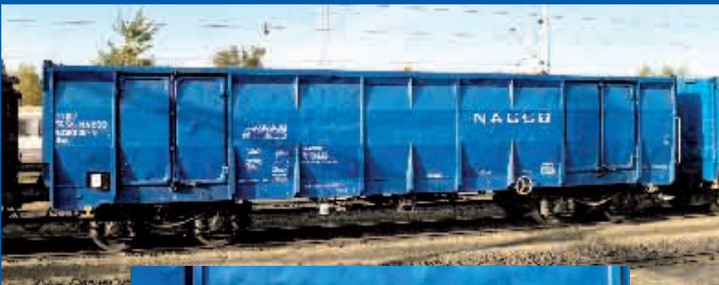
Hochbordwagen Typ LOWA der SK (Slowakische Rep.) Epoche V Best.-Nr. 65355 (TT) ca. IV/2007